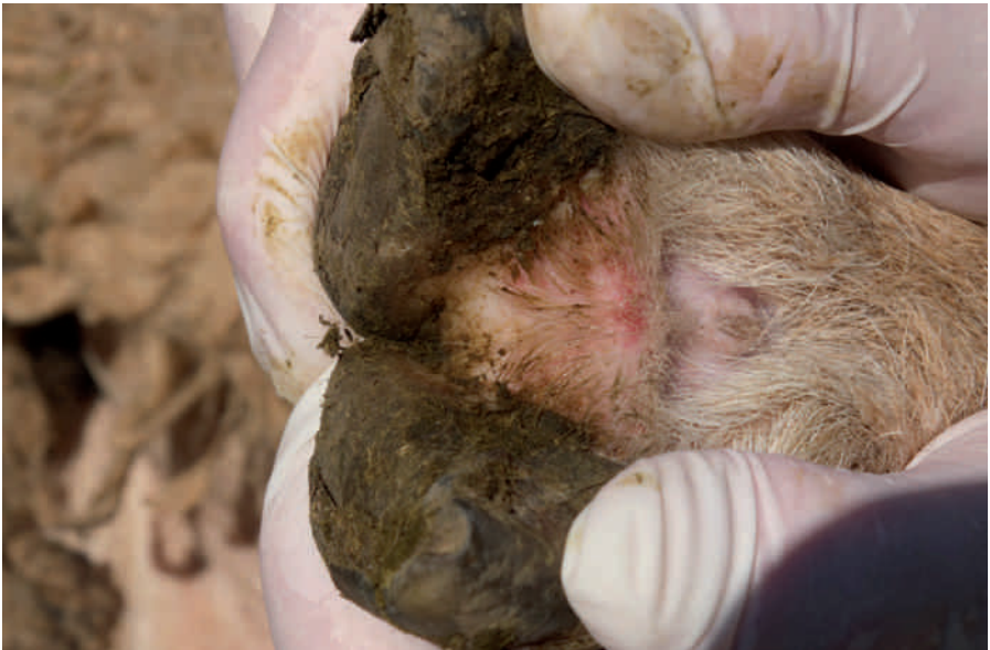
Entzündung der Haut im Zwischenklauenspalt im Anfangsstadium der Moderhinke (Dermatitis interdigitalis)