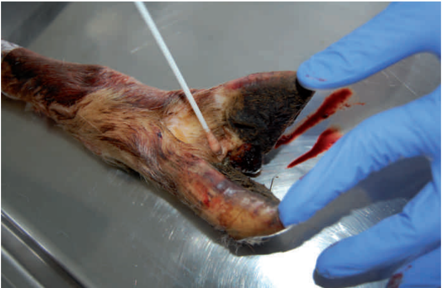
Demonstration der Probennahme mittels Tupfer im Zwischenklauenspalt anhand eines Sektionspräparates