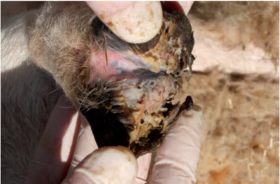
Bei fortschreitender Erkrankung kommt es zu massiven und schmerzhaften Schädigungen des Klauenhorns