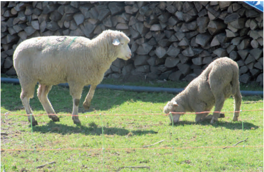
Das Knien auf den Karpalgelenken entlastet die Klauen bei der schmerzhaften Moderhinke